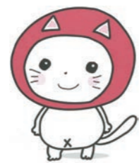
赤羽幼稚園 50周年記念キャラクター "ねこまる"